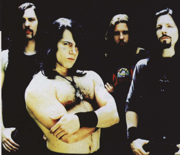
"CUANDO ESTUVIMOS DE GIRA CON METALLICA TUVIERON QUE SEPARARNOS. CUANDO ESTUVIMOS EN IRLANDA VOLCÁBAMOS COCHES Y FURGONETAS"

"No tenía que preguntárselo, él ya te lo contaba todo. Te decía, '¿eres cazador? Deberías venir a cazar conmigo'. Te empezaba a hablar de los amantes de los animales y todas esas cosas. Él decía que entendía su punto de vista, pero que él era el mejor conservador y el mejor amigo que tenían. Seguía y seguía, explicando cómo fue hasta Nuevo México para enseñar a los indios cómo disparar con arco y flecha porque se les había olvidado. Cuando me lo encontré por primera vez él estaba detrás del escenario del Teatro Griego disparando flechas a